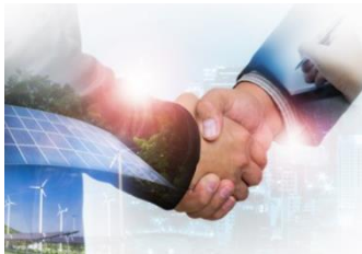
Business Research Centre

Inholland beschikt over in totaal 7 onderzoeksgroepen en 41 lectoraten. Het gedeelde ideaal van de onderzoeksgroepen is het bijdragen aan een duurzame, gezonde en creatieve samenleving in samenwerking met onze studenten, het werkveld en maatschappelijke partners. Hieronder een greep uit het brede scala aan mogelijkheden. Voor ieder vraagstuk een passend thema! Bekijk onze website voor meer informatie over alle onderzoeksgebieden van Inholland: www.inholland.nl/onderzoek