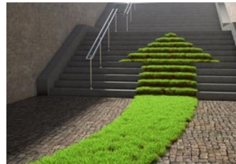
Research and Innovation Centre Agri, Food & Life Science

Het publiek vertrouwen in veiligheid en de toegankelijkheid van het recht.