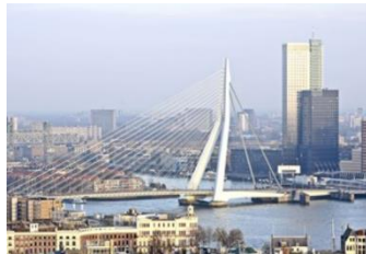
Recht en Veiligheid

Focus op organisatieontwikkeling, ondernemerschap en duurzame innovatie.