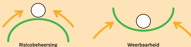
Figuur 1: verschil tussen risicogedreven inrichting van plantgezondheid en een op weerbaarheid gefundeerde aanpak. (Uit: Erismans et al., 2016. AIMS Agriculture and Food Volume 1, Issue 2, 157-174 ).

Geïntegreerde gewasbescherming is nu al het streven in de plantaardige productie. Hiermee is vooruitgang geboekt. Plantgezondheid op basis van weerbaarheid gaat nog een stap verder en vergt een paradigmaverandering (figuur 1). In de traditionele, risicogestuurde benadering is er sprake van een kwetsbaar evenwicht, waarbij kleine veranderingen in het systeem er al voor kunnen zorgen dat ziektes en plagen de kop op steken en bestreden moet worden. In de nieuwe benadering is er sprake van een robuust systeem, waarbij kleine veranderingen opgevangen kunnen worden door het systeem zelf.